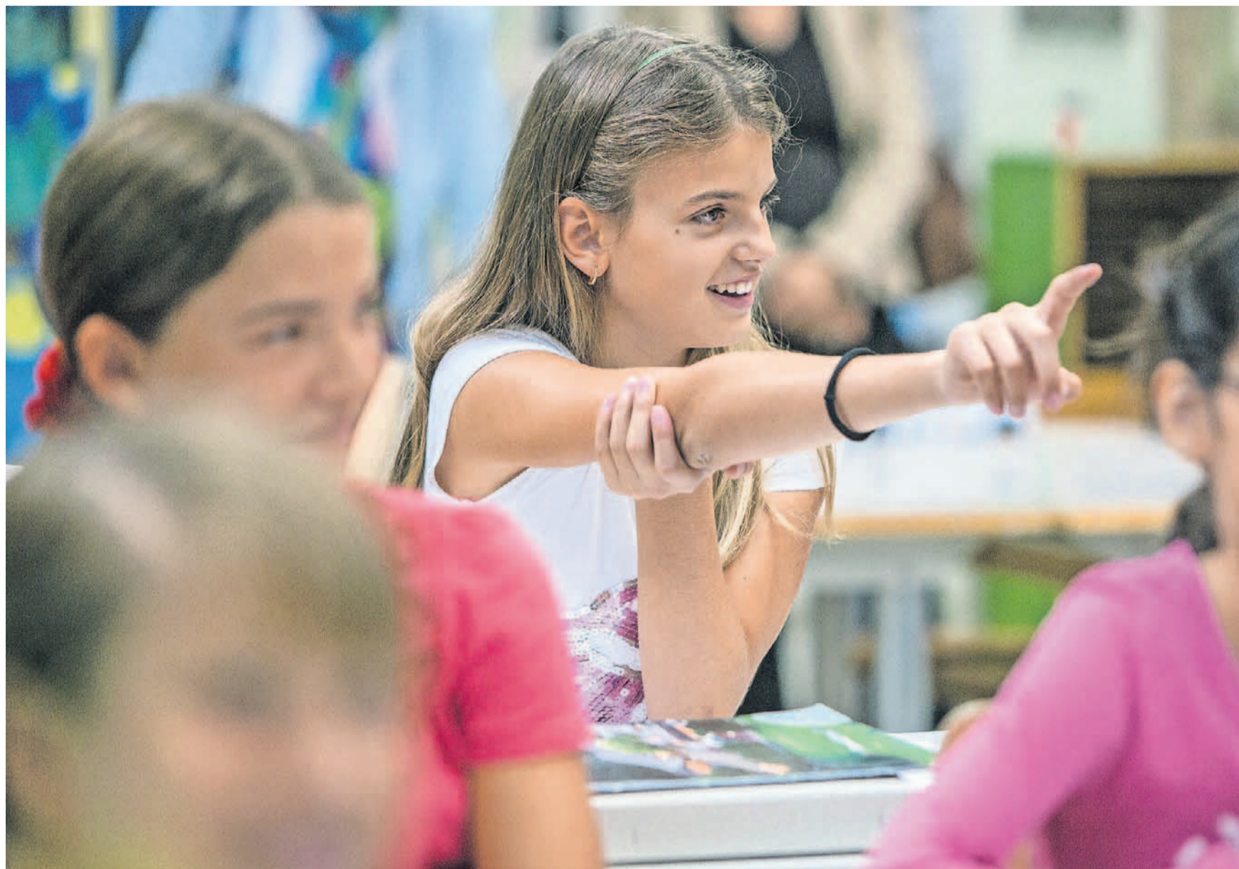
Die Schweizer Volksschule muss harmonisiert werden, so steht es seit 2006 in der Bundesverfassung. Doch die Kantone wollen den Volksauftrag nicht umsetzen.