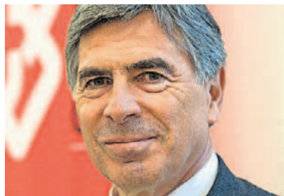
Christoph Eymann Erziehungsdirektor Basel-Stadt (LDP), Präsident der Schweizerischen Konferenz der kantonalen Erziehungsdirektoren (EDK)

Amsler: Ich bin auch Präsident der Interkantonalen Lehrmittelzentrale. Die Erfahrung zeigt: Lehrmittelverlage sind auf eine Harmonisierung und Koordination angewiesen, weil sonst das Entwickeln eines Lehrmittels viel zu teuer wäre. Der LP21 ist vereinbar mit Harnos, Harnos und LP21 sind aber voneinander unabhängig. Die Realität